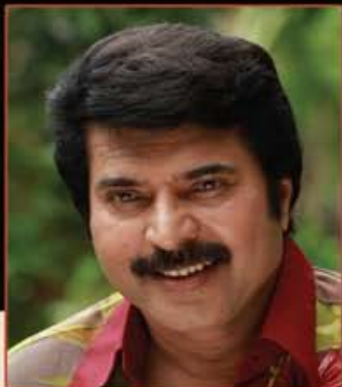
Mammooty Chairman, Kairali TV