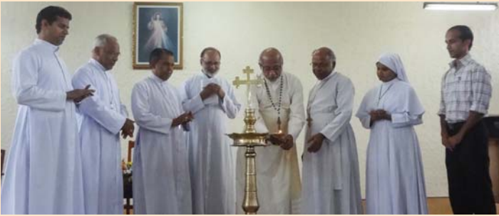
കമ്മീഷൻ ഫോർ ഇവാഞ്ചലൈസേഷൻ ആന്റ് പാസ്റ്ററൽ കെയർ ഓഫ് ദി മൈഗ്രന്റ്സ് കാക്കനാട് മൗണ്ട് സെന്റ് തോമസിൽ സംഘടിപ്പിച്ച ശില്പശാല സീറോ മലബാർ സഭ മേജർ ആർച്ച്ബിഷപ്പ് കർദിനാൾ മാർ ജോർജ്ജ് ആലഞ്ചേരി ഉദ്ഘാടനം ചെയ്യുന്നു.

സീറോ മലബാർ സഭയിലെ കേരളത്തിനകത്തും പുറത്തുമുള്ള വിവിധ രൂപതകൾ, സന്യാസസഭകൾ, സെമിനാരികൾ, സംഘടനകൾ, മാധ്യമങ്ങൾ എന്നിവയുടെ പ്രതിനിധികൾ ശില്പശാലയിൽ പങ്കെടുത്തു.